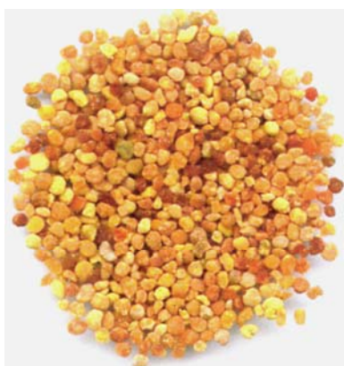
Figura 2. Pólen recolhido por abelhas

A composição do pólen varia de acordo com a planta que o originou, existindo muito maior diversidade do que em qualquer outro produto da colmeia. O pólen é recolhido pelas abelhas nas flores das espécies por elas seleccionadas, contendo uma pequena % de açúcares derivados do mel (ou do néctar) que as abelhas misturam aquando da constituição das cargas polínicas que transportam nas suas patas.