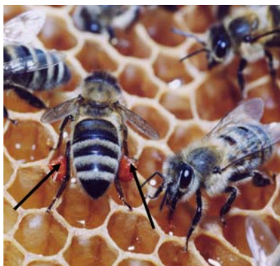
Figura 10. Abelha com carga de própolis

O facto das abelhas recolherem resinas de plantas para produzir própolis foi confirmado pela primeira vez por Rosch em 1927. Embora fosse nessa data comumente aceite que a própolis tinha origem botânica, não ficou claro quais as espécies de plantas que seriam utilizadas como fontes. A dificuldade na