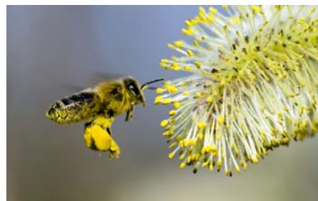
Figura 3. Abelha em pastoreio de pólen

A produção de pólen por parte dos apicultores necessita de conhecimentos específicos, mas a sua produção em termos comerciais apenas terá sucesso em zonas onde exista muita disponibilidade deste recurso. As regiões mais secas do país (Beira Interior e Alentejo) são as mais favoráveis, na medida em que a humidade é a principal inimiga desta produção.