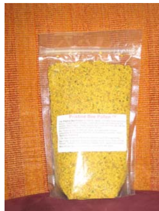
Figura 7. Embalagem plástica de pólen