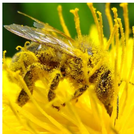
Figura 1. Abelha coberta de pólen

As flores das plantas polinizadas pelo vento (anemófilas) produzem grãos de pólen leves e secos, que facilmente são transportados pelo vento. As flores das plantas entomófilas (polinizadas pelos insectos) produzem, por norma, pólen e néctar, tendo os grãos de pólen a característica única de estarem envolvidos por uma película adesiva, que contribui para que facilmente fiquem presos aos pelos dos insectos com pelo como as abelhas. Quer o pólen das plantas anemófilas, quer o das plantas entomófilas é recolhido pelas abelhas.