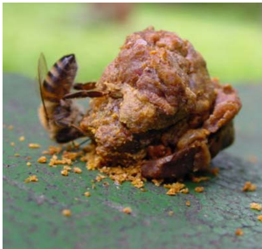
Figura 8. Abelha sob própolis

Esta substância, elaborada pelas abelhas, é conhecida do Homem desde tempos imemoriais. Foi utilizada por sacerdotes egípcios e mais tarde, os gregos, atribuíram-lhe a denominação de Propolis, I que significa “antes de” e polis que significa cidade, ou seja a antes da colónia, a protegê-la.