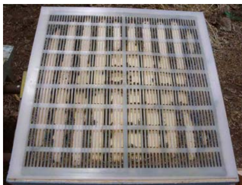
Figura 13. Redes para recolha de própolis

Será útil colocar as redes de forma simétrica a toda a largura sobre as alças, mudando-as para outro extremo passadas algumas semanas, de forma a incentivar as obreiras a preencher os espaços vazios, promovendo a recolha de resinas. A melhor época para a introdução das redes é a Primavera e o Outono, podendo ser retiradas em qualquer época do ano. Após a sua retirada devem ser de imediato congeladas (a temperaturas entre os -10 e os -20°C) pelo menos durante uma hora, para que a própolis se torne dura e ao mesmo tempo frágil, logo fácil de separar através da manipulação da rede.