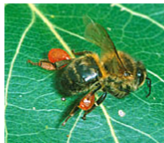
Figura 9. Abelha em pastoreio de própolis

Em épocas ou em locais onde as plantas fonte da própolis escassearem as colónias podem sofrer com essa escassez de própolis, tendo inclusivamente sido observadas abelhas a recolher "substituintes da Própolis", como asfalto, tintas ou óleos minerais. Estes substituintes da própolis são misturados com a resina disponível e utilizados nas colmeias. Mesmo quando estão reunidas todas as condições para a recolha de Própolis, e em regiões onde não haja escassez de fontes de resina vegetal, a proporção relativa de cera na própolis depende do fim a esta se destina, ou seja, a própolis usada para reparar favos de mel é frequentemente complementada com grandes quantidades de cera, o que confere uma composição mais firme à própolis. Pelo contrário a própolis utilizada para revestir a face interna das células de criação, contém muito pouca ou nenhuma cera, pois esta não tem qualquer efeito antimicrobiano.