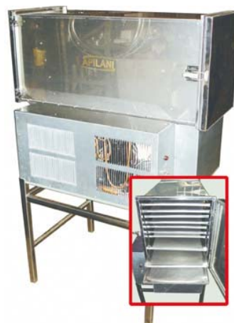
Figura 6. Secador de pólen

Após seco, procede-se à limpeza final, podendo usar-se para tal peneiras ou ventilação forçada. A limpeza do pólen pode ser manual, mediante o uso de pinças ou mecanizada. Depois de limpo e seleccionado o pólen pode ser embalado em sacos plástico, hermeticamente fechados, de capacidade variável (comércio a grosso), ou em embalagens de vidro de capacidade variável cujo destino será o comércio a retalho.