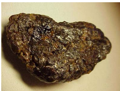
Figura 12. Bola de própolis

A quantidade de própolis produzida por uma colmeia depende essencialmente do comportamento de pastoreio de resinas por parte das obreiras e no tipo de vegetação circundante.