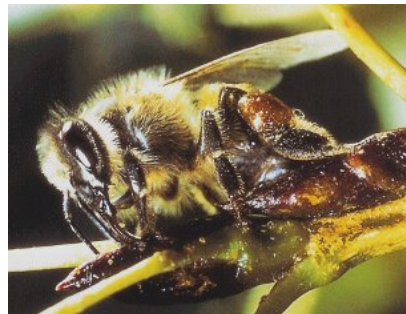
Figura 11. Abelha em pastoreio de própolis

A colheita de própolis obedece a um comportamento específico de pastoreio. As abelhas envolvidas nesta tarefa recolhem as resinas usando as suas mandíbulas e o primeiro par de patas. Algumas secreções permitem a sua suavização e esmagamento, para possam ser transportadas em cargas. Ao entrar na colmeia, estas obreiras dirigem-se de imediato para os locais onde é necessária, permitindo que as abelhas propolizadoras retirem as resinas, as comprimam e adicionem cera.