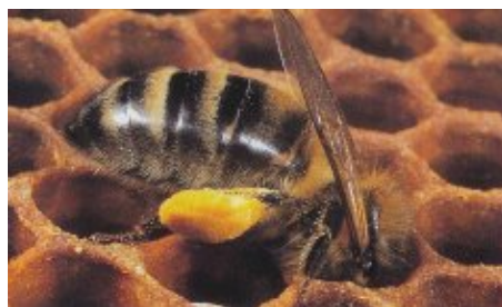
Figura 4. Abelha a armazenar pólen

As abelhas não conseguem manter a sua criação saudável sem pólen, pelo que o apicultor deve sempre manter especial atenção ao bem-estar das suas colónias, quando pretende orientar a sua exploração para a produção deste recurso. Enquanto as colmeias estão equipadas com capta-pólens, uma parte do pólen recolhido pelas obreiras persiste em entrar na colónia. Esta proporção varia de acordo com os tipos de equipamento utilizado (e as dimensões das grelhas), podendo ir dos 10 aos 60%. As obreiras em colheita de pólen podem rapidamente adaptar-se à dimensão das malhas, formando cargas polínicas de menores dimensões. Assim, é recomendado que os capta-pólens sejam retirados 10 a 15 dias após a sua colocação, permitindo desta forma equilibrar o aporte de pólen para o interior da colónia, e dessa forma fazer face às necessidades da criação presente no seu interior. Alguns autores propõem um esquema de recolha que passa pela colocação dos capta-pólens durante três semanas, retirando-os durante a quarta semana. Um estudo realizado em França aponta para quebras de produção de pólen na ordem dos 24 % em colónias onde os capta-pólens ficaram colocados durante 40 dias seguidos.